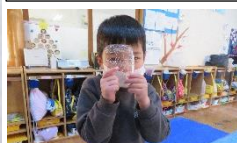
氷の結晶きれいだ！

次に繋がる氷の不思議！そら組の氷ブームが今園内に広がっています。遊びの様子はホールの掲示をご覧ください