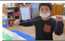
糸で氷が釣れた！何故？