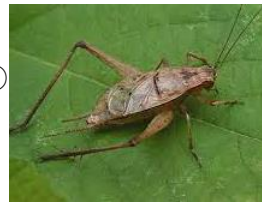
② ( ) ( )