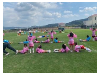
4・5歳の表現(おばけです)