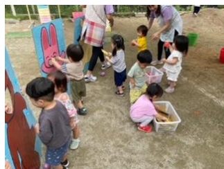
1歳児は「ノンたんの大運動会」