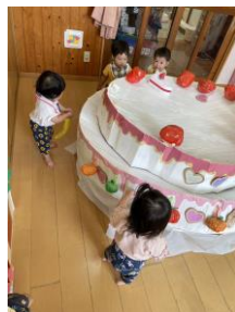
0歳児は「のせてのせて」です。