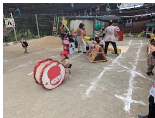
支援センターは「だるまさんがころんだ」です

お月見とは、1年の中で最も空が澄みわたる旧暦の8月に、美しく明るい月を眺める行事のことで、「十五夜」ともいいます。お月見には、美しい月を眺めるだけでなく、収穫に感謝して、月に見立てたものや収穫物をお供えするという習慣もあります。私も月を眺めて家族で団を食べた思い出が・・・皆さんもいかがですか？美しいですよ。 今年の十五夜は、9月29日だそうです。(本日は)