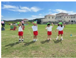
3歳は「虹色の魚」です