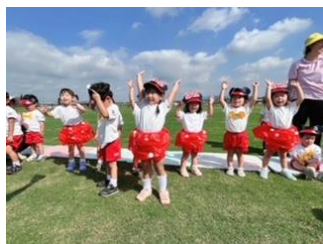
2歳児はミッキー♡ミニーで踊ります。虫の競技もお楽しみに